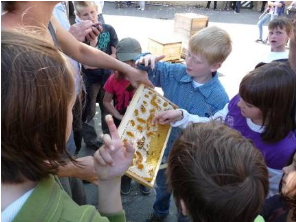
Abb.9: Die Jungimker von morgen sind bereits Honigkenner