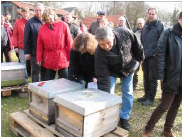
Abb.4: Imkersprechstunde mit praktischen Übungen und Demonstrationen auf Haus Düsse. Imker/Innen prüfen im März durch Gewichtskontrolle den Futtermvorrat der Völker.

Einen zweiten Schwerpunkt des neuen Angebotes bildete die Fortbildung von Multiplikatoren , sowie Erarbeitung umfangreichen Schulungsmaterials, das diese Referenten dann in ihren Kursen frei nutzen können. Der Landesverband Westfälischer und Lippischer Imker e.V. unternimmt seit Jahren intensive Anstrengungen, seinen Mitgliedern flächendeckend kompetente Ansprechpartner zur Verfügung zu stellen. Um die Anzahl und den Wissensstand dieser Multiplikatoren weiter zu steigern, konnten Referenten nicht nur an einer speziellen Schulung mit didaktischem, rhetorischem und imkerfachlichem Inhalt teilnehmen, sowie am Landwirtschaftszentrum Haus Düsse den imkerlichen Beratungsterminen beiwohnen und anschließend