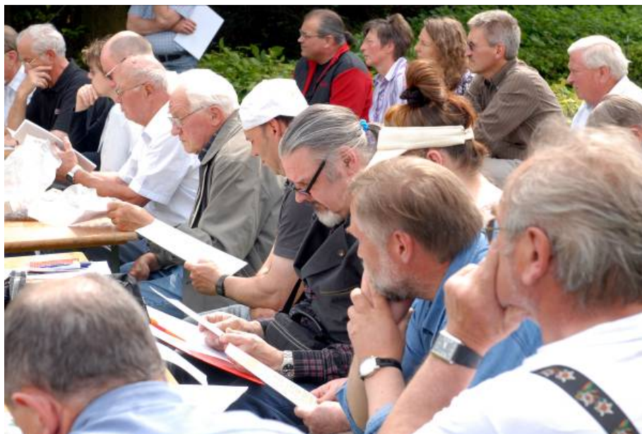
Abb.6: Referenten studieren ausgehändigtes Schulungsmaterial