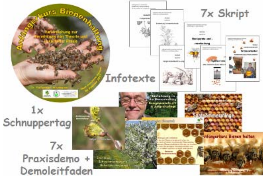
Abb.5: Die Schulungs-DVD enthält Power-Point-Präsentationen, Skripte, Infotexte und Leitfäden mit Tipps für die Durchführung spannender und aktueller Kurse