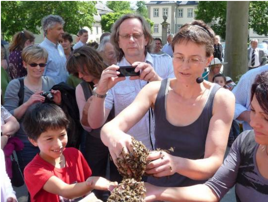
Abb. 7: Gelungene Werbung für handzahme Bienen. Beim BUND-Thementag verloren auch Unerfahrene schnell die Angst vor Stichen